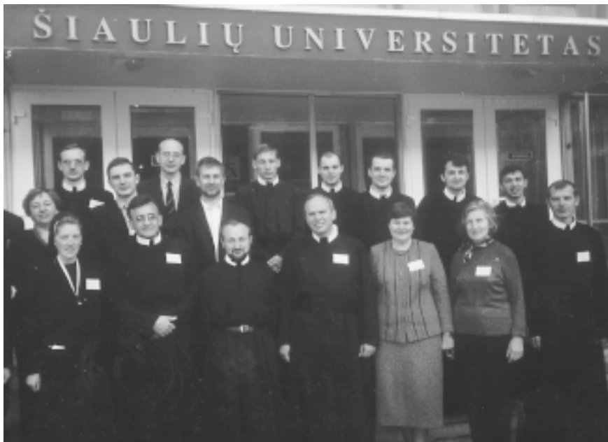
2003 m. konferencijos dalyvių grupė prieš išvykstant į Bazilionus