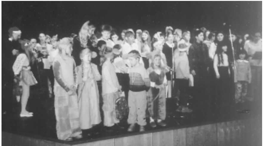
Baigiamasis Antrojo tautinių mažumų sekmadieninių mokyklų festivalio akordas. Scenoje festivalio dalyviai.

Tautinių mažumų ir išeivijos departamentas ir Tautinių bendrijų namai siekdami paskatinti įvairių tautų Lietuvos jaunimą domėtis savo kultūra, kalba, papročiais, ugdyti pagarbą ir toleranciją kitų tautų tradicijoms, ši festivalį paskyrė „Nacionalinėms pasakoms,„. Sekmadieninių mokyklų kolektyvai turėjo pasirinkti ir kalba,