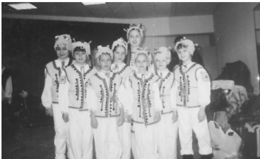
Festivalio dalyviai - Vilniaus ukrainiečių bendrijos sekmadieninės mokyklos auklėtiniai.

Iki sekančio susitikimo tradiciniame Tautinių mažumų sekmadieninių mokyklų festivalyje.