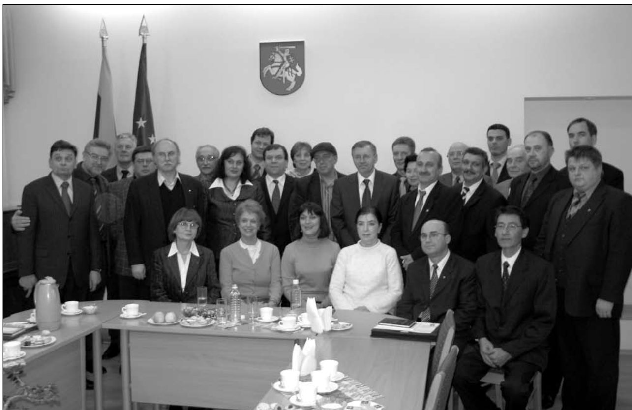
Члены Совета национальностей сфотографировались на память с премьер-министром Литвы Гедиминасом Киркиласом