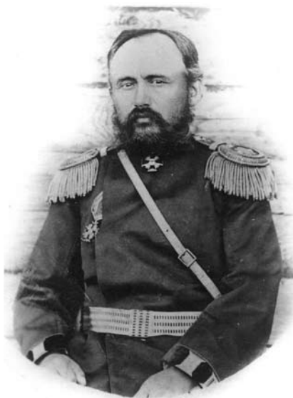
Generolas ltn. Chalilis Bazarevskis

1890 metų kovo pabaigoje Ch. Bazarevskis buvo apdovanotas Šv. Anos antrojo laipsnio ordinu, jam suteiktas papulkininkio laipsnis ir jis paskirtas 10-osios artilerijos brigados 2-osios baterijos vadu.