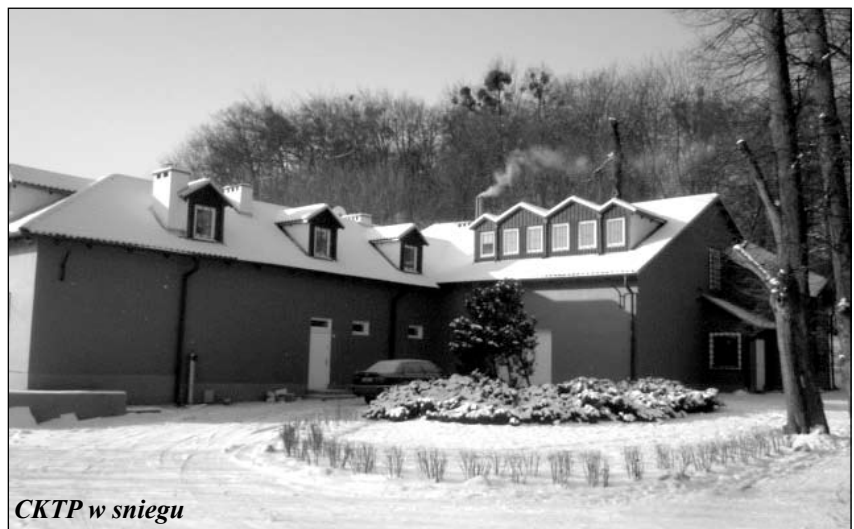
CKTP w sniegu