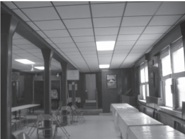
LDK totorių namo pirmo aukšto salė.