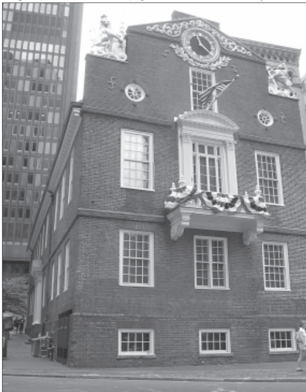
Iš šio Bostono senosios merijos pastato balkono pirmą kartą buvo pastelbta JAV Nepriklausomybės deklaracija.