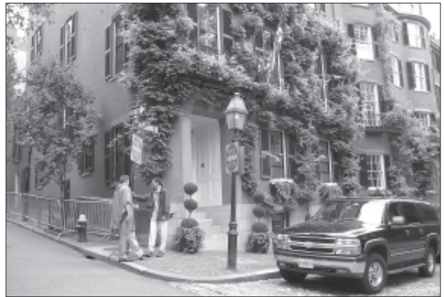
Tai kandidato į JAV prezidentus Dž. Kerio namas Bostone.