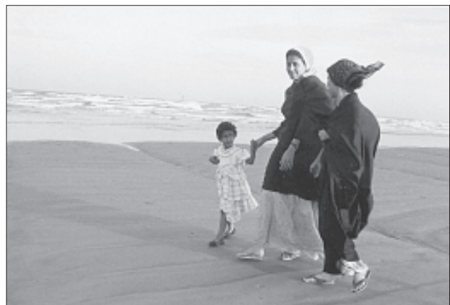
Pasivaikščiojimas prie Adeno įlankos