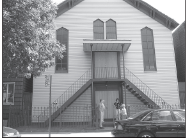
LDK totorių mečetė Bruklina. Vaizdas iš gatvės.