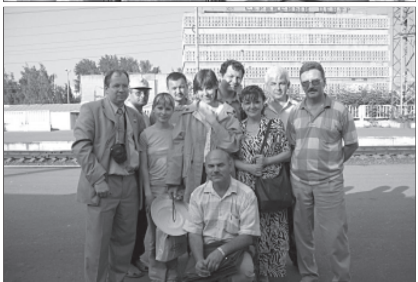
Nuotraukos iš Pasaulio totorių jaunimo forumo su mūsų delegacijos nariais.

rauti neformaliai. Tai įrodė ir mūsų delegacijos nariai, susipažinę, ko gero, su