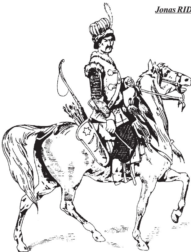
Lietuvos totorių rotmistras, XVII a. vidurio piešinys.