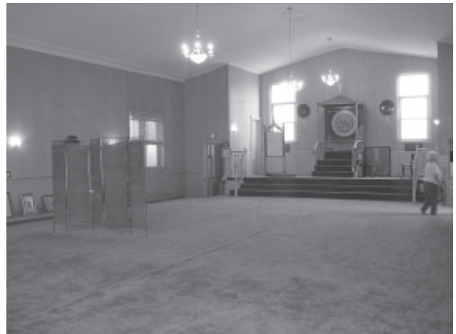
Antro aukšto salė - mečetė.