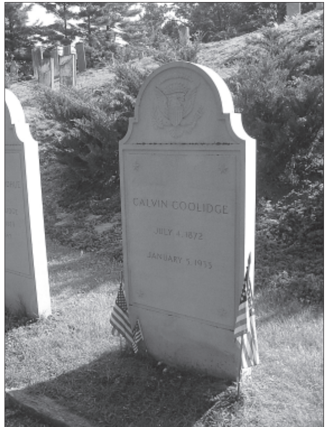
Kuklus 30-tojo JAV prezidento Calvin Coolidge (1923-1929) kapas Vermonto valstijos kaimo kapinėse.