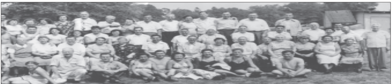
LDK totorių pikniko dalyviai 1949 metais.