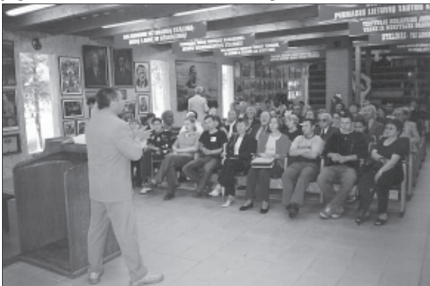
Oriento dalyvių ekskursija Grūto parko agitpunkte.