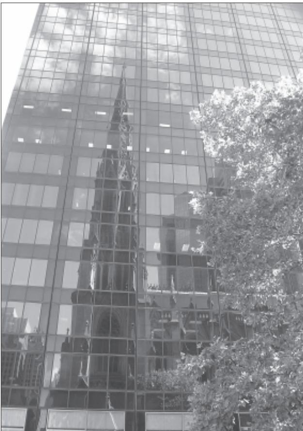
Priešais šį dangoraižį Manhetene yra Šv. Patriko katedra. Stiklinėje sienoje ji atsispindi lyg veidrodyje.

Lankėmės Rod Ailendo saloje, kuri yra to pat pavadinimo (Nukelta į 8-tą psl.)